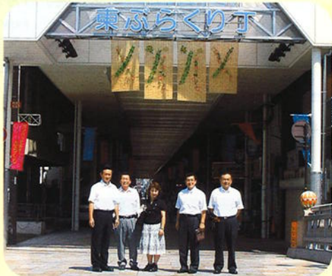
② 和歌山市「ぶらくり丁商店街」視察