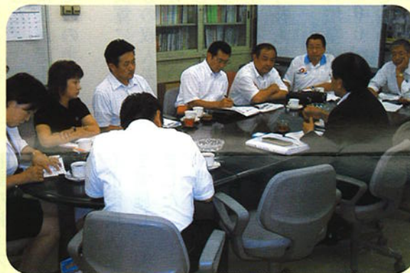
③ 高松市丸亀町商店街活性化計画について説明を受ける