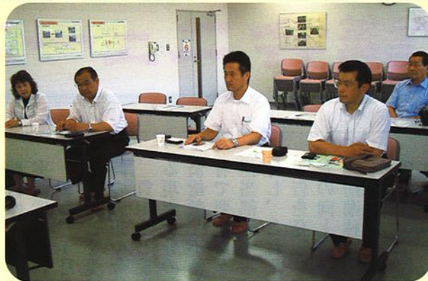
① 亀山市総合環境センターで施設説明を受ける