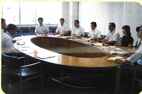
④ 松山市教育支援センター視察